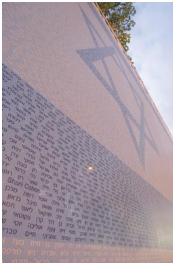
דגל הפיוס הורכב משמותיהם של 32,000 איש שחתמו על "עצומת הפיוס" של צו פיוס לקראת ההתנתקות מחבל עזה.