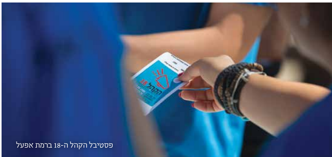
פסטיבל הקהל ה-18 ברמת אפעל