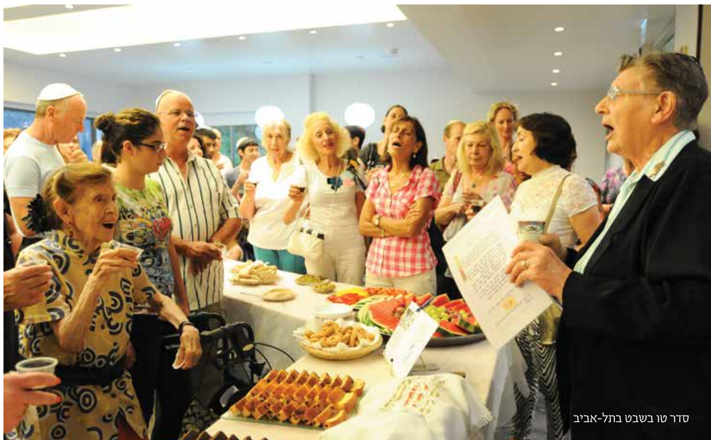
סדר טו בשבט בתל-אביב

http://www.midot.org.il/Sites/midot/content/File/hithadshut_yehudit/hithadshut_file_04.pdf