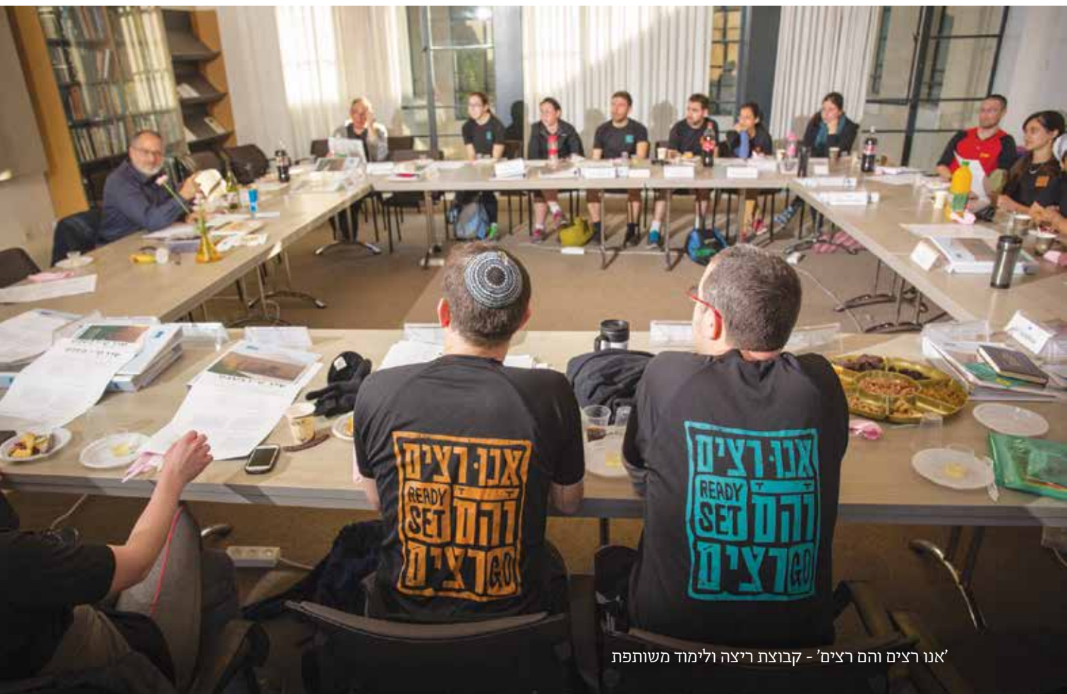
'אנו רצינים והם רצינים' - קבוצת ריצה ולימוד משותפת