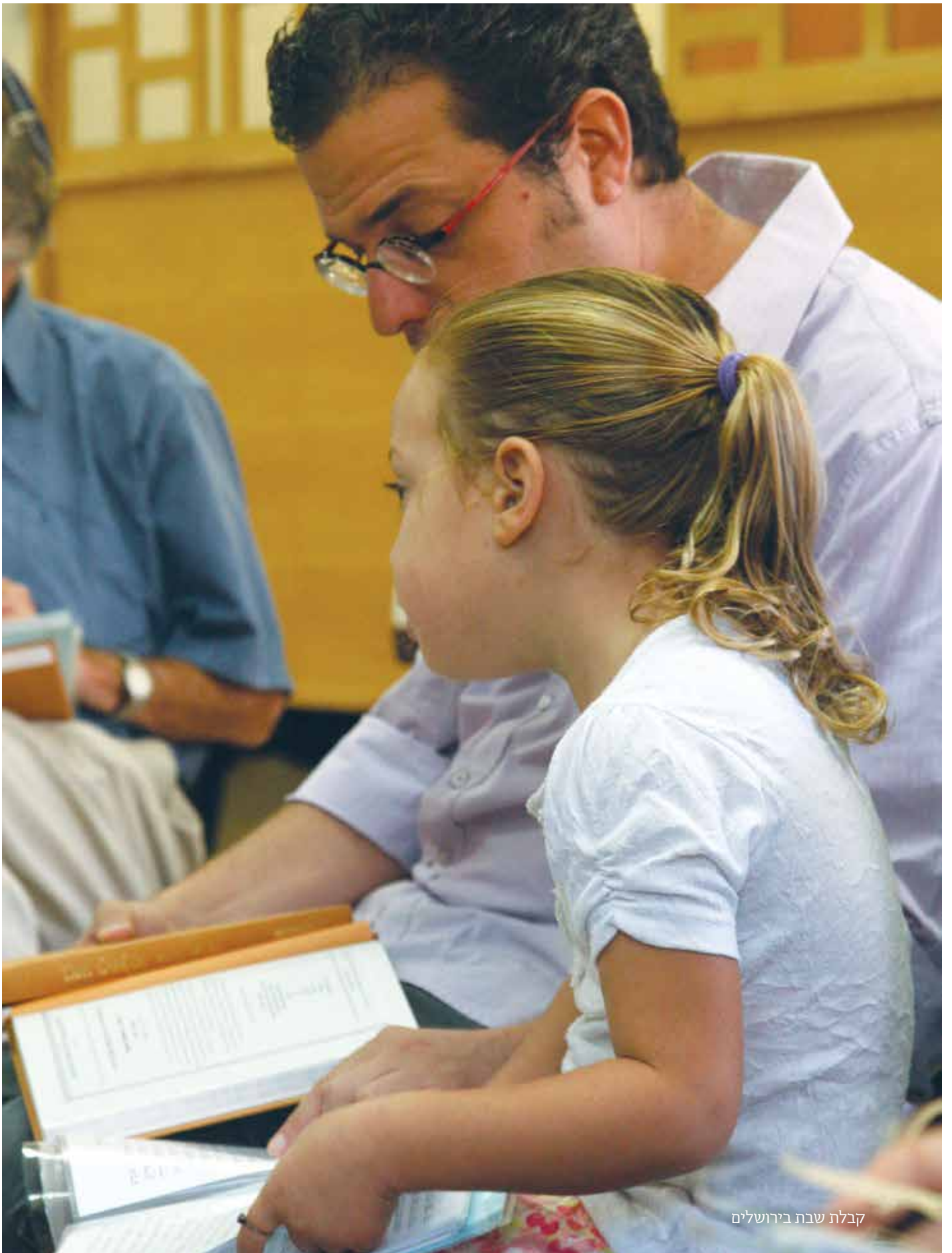
קבלת שבת בירושלים