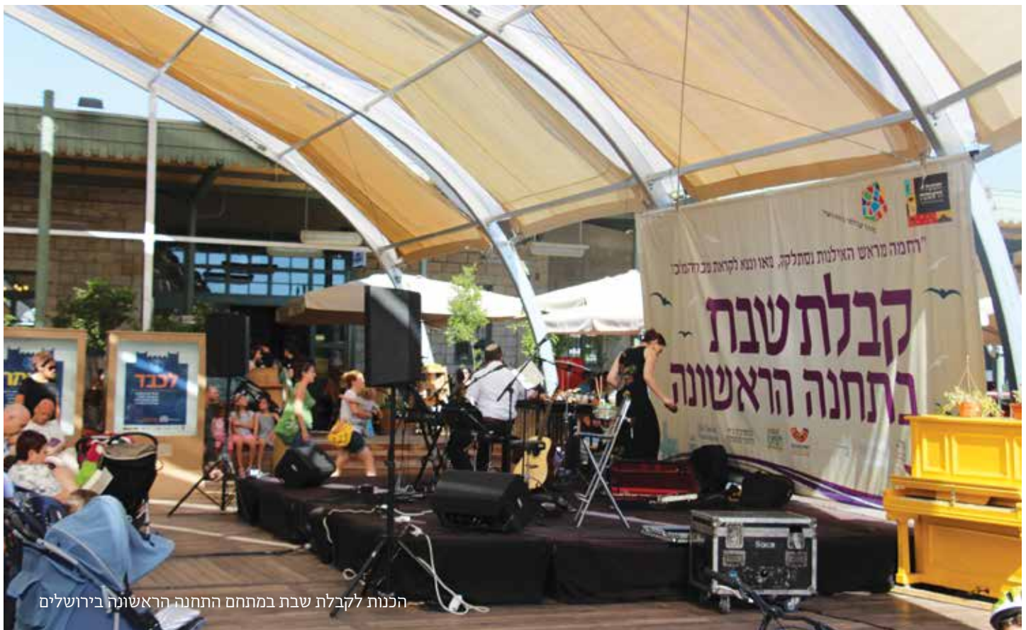
הכנות לקבלת שבת במתחם התחנה הראשונה בירושלים

ימים יגידו אם תכניות אלה אכן יצליחו להגיע אל לב הזרם המרכזי של הציבור היהודי בישראל, ולא פחות חשוב מכך – גם לזכות באהדתם של מוסדות המדינה ולזכות במקורות המימון הנובעים מכך. עדיין לא ברור אם הארגונים הרבים יבשילו כולם ויגיעו לכדי יציבות פיננסית. היסודות הונחו והכול עדיין אפשרי, ואנו נמצאים בצומת קריטי. כיוון שכעת ניכרת אהדה ציבורית גוברת לחינוך ערכי, ניתן להבחין בהכרה בסוגיית הניתוק מהעבר היהודי העשיר ומהבורות בתכניו, ובצמצום ממדי ההתנגדות למסגרות של לימוד משותף והחשש מפני תיוג לימוד שכזה כחזרה בתשובה. זאת ועוד, ניתן גם לזהות הבנה רווחת לכך שנוצרת כעת הזדמנות למנף את כל אלה, כדי לחולל שינוי תרבותי וחברתי. מטרת המדריך הירוק שלפנינו להציג בפני התורמים את התופעה על השלכותיה והסיכויים הטמונים בה, ולסייע להם לרדת לעומקה.