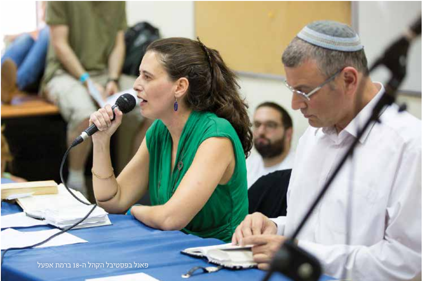
פאנל בפסטיבל הקהל ה-18 ברמת אפעל