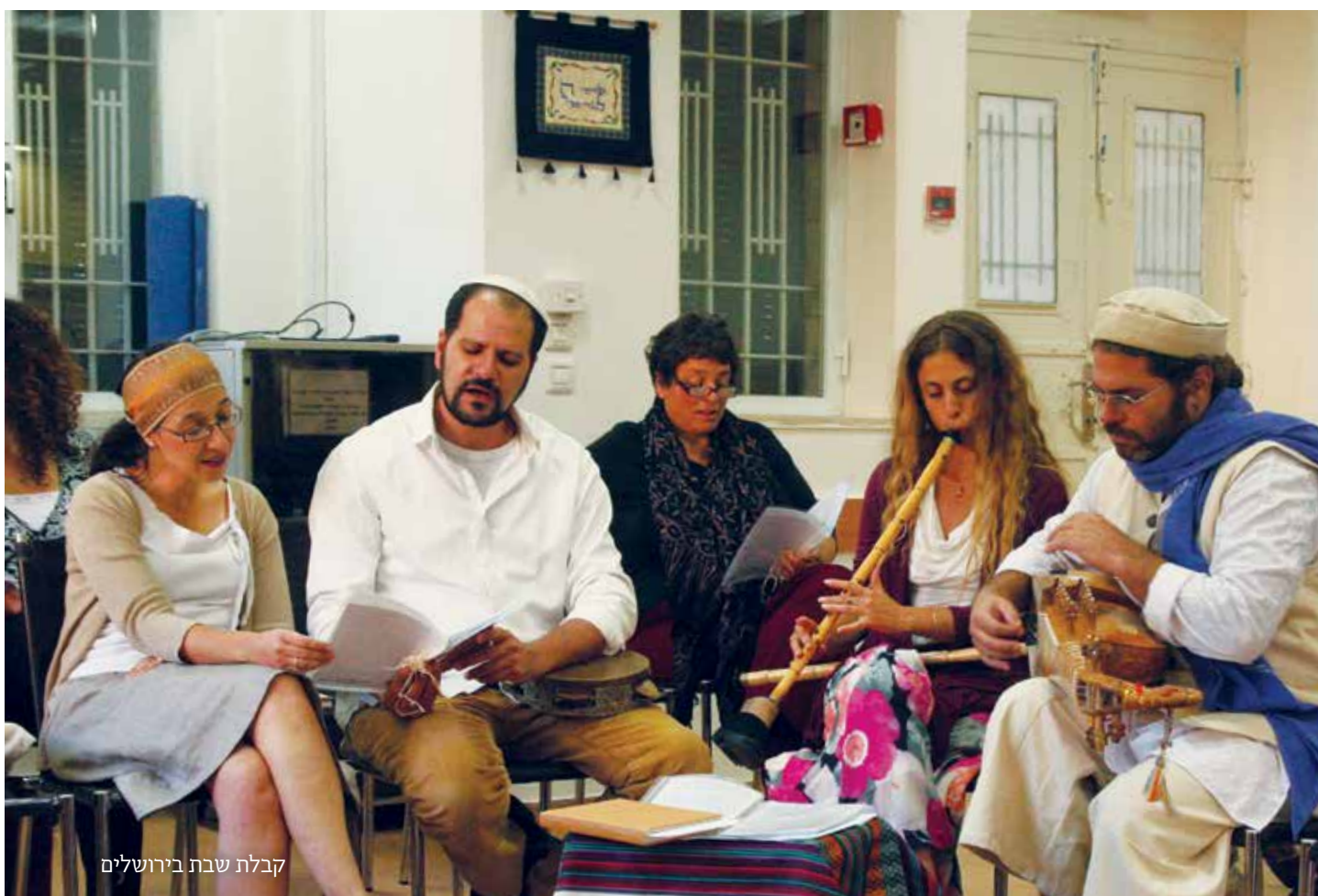
קבלת שבת בירושלים