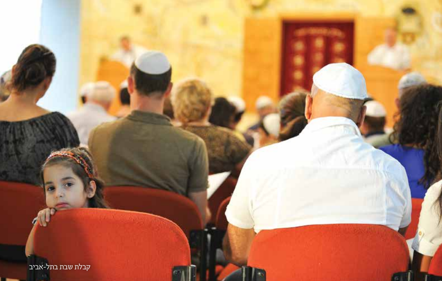
קבלת שבת בתל-אביב